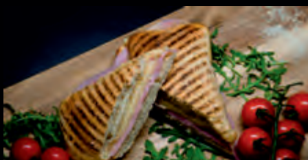
PANINO CLASSICO ITALIANO 3,90 €