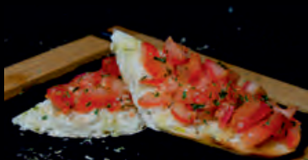
BRUSCHETTA CLASSICA 3,90 €