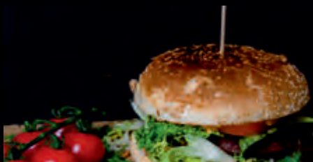
PREMIUM ANGUS BURGER 7,90 €