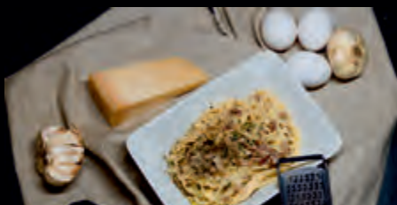
SPAGHETTI CARBONARA ŠPAGETY CARBONARA 7,90 €