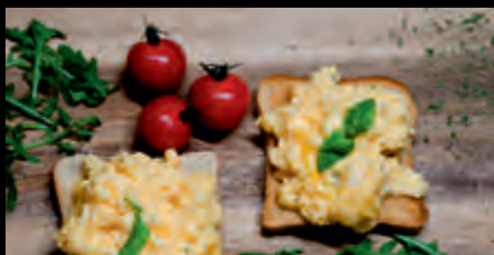
SCRAMBLED EGGS ON TOASTS PRAŽENICA NA TOASTOCH 3,90 €