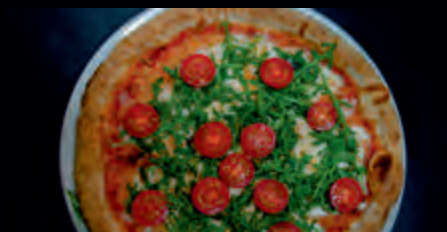
PIZZA ORIGINALE OD / FROM 5,90 €