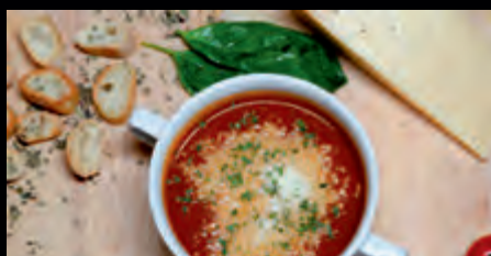
PARADAJKOVÁ POLIEVKA S PARMEZÁNOM 3,50 €