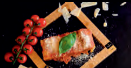
LASAGNA BOLOGNESE 7,90 €